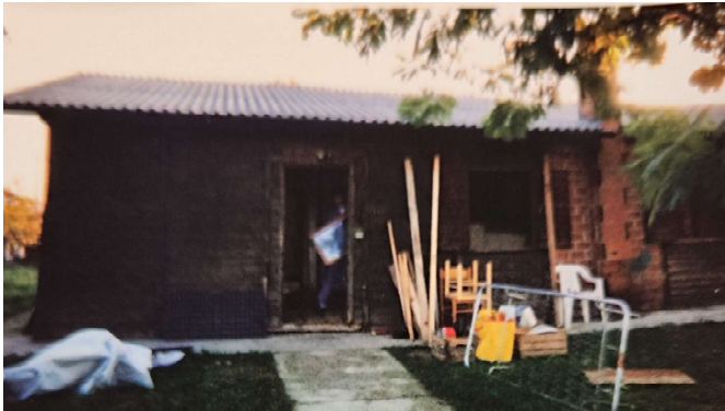
Fine anni '90 La nostra prima sede