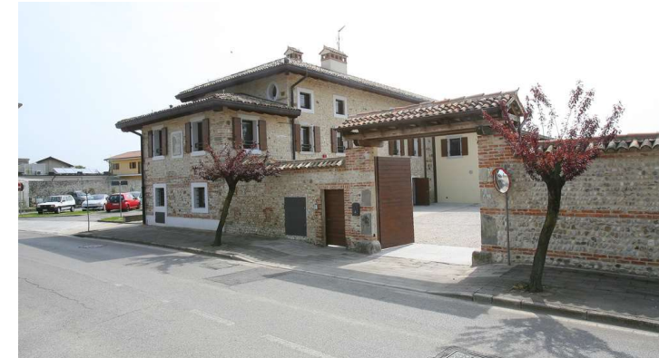
2024 Inaugurazione di Casa Nostra a Lovaria di Pradamano